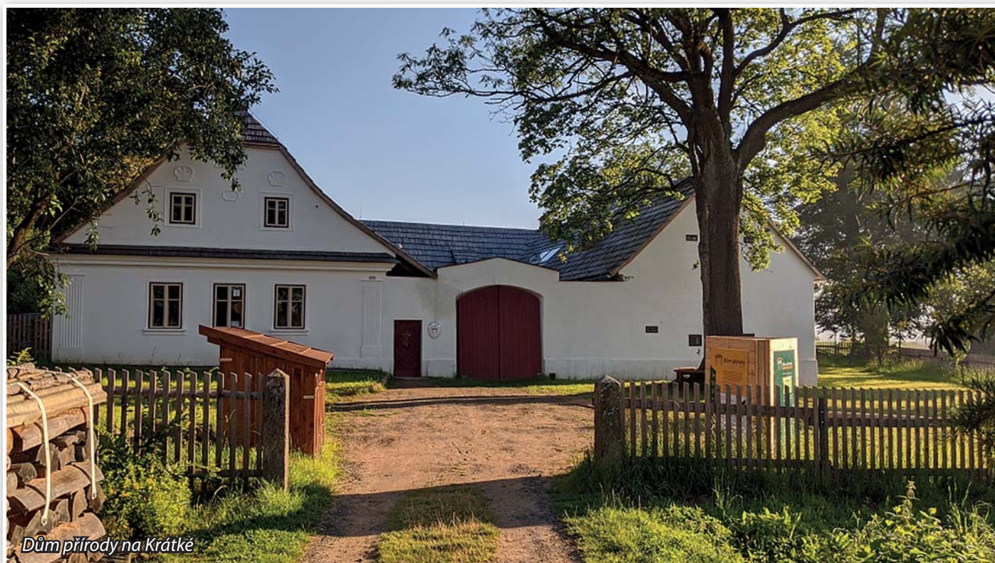
Dům přírody na Krátké