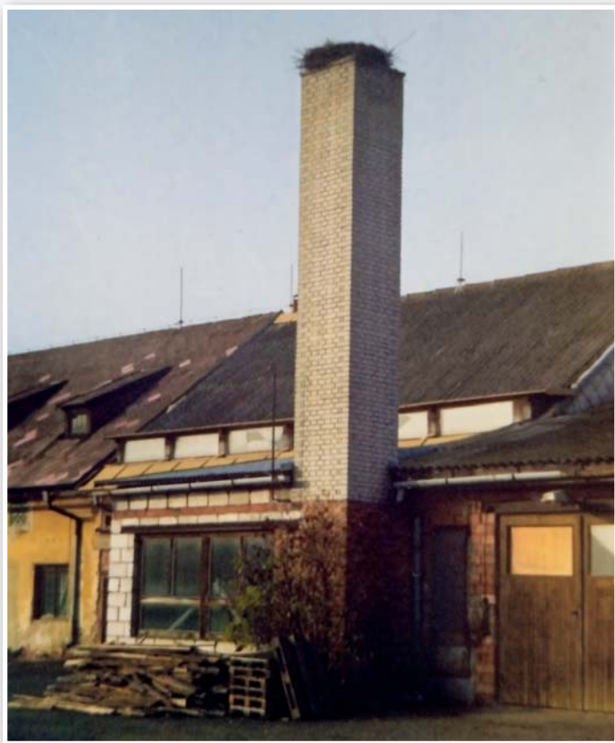
V 90. letech se čápí hnízdo objevilo i v areálu zemědělského družstva.

Na území České republiky hnízdí čápi bílí od pradávna. Podle některých pramenů se zprávy o čápech, jako ptáčích „vodových“, objevují od 14. století. Tehdy nešlo o hojně se vyskytující druh, ale spíše vzácnost. Teprve v souvislosti s budováním rybníků v 15. a 16. století, došlo k jejich většímu rozšíření.