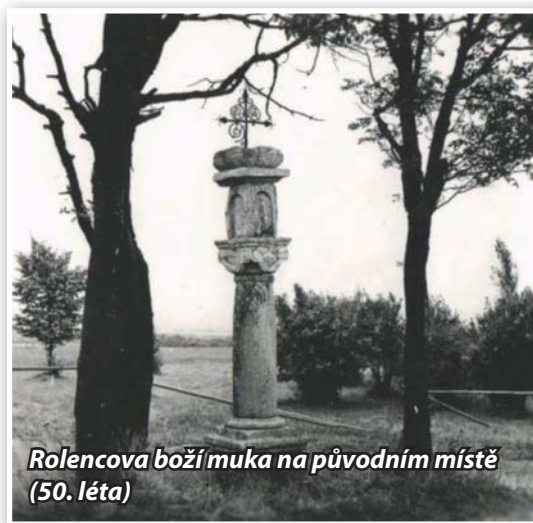
Rolencova boží muka na původním místě (50. léta)

kou Rolenc :-). Po něm se pak na domě, dá se říci po několik století, udrželo přízvisko „u Rolenců“.